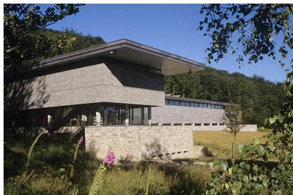
Centre archéologique du Beuvray