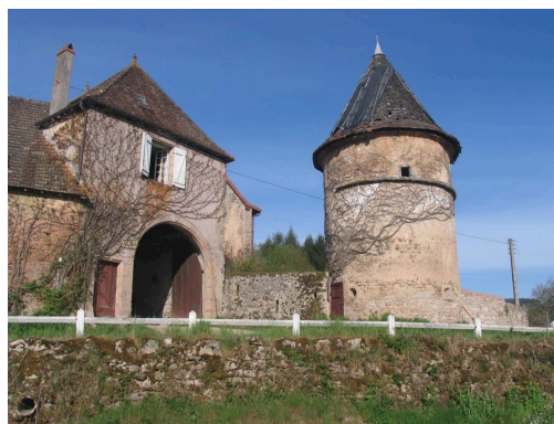
St-Léger-sous-Beuvray : la Boutière