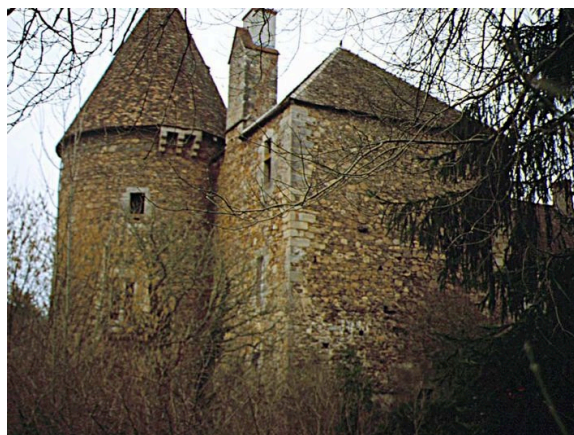
Maison forte de Chissey-en-Morvan